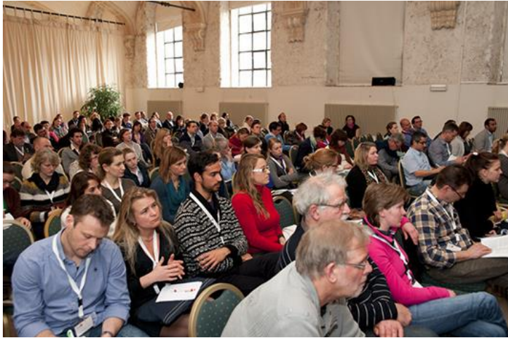
Foto2 : Publiek 6de EEHNC